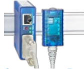
Web-Sensoren für Raumluft

Hier finden Sie Geräte mit Sensorik für %rH, hPa & CO 2