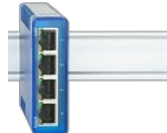
Gigabit Switch Industry

Vernetzung im Schaltschrank 24V Versorgung