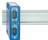
RS232 <-> RS422/RS485 Industry