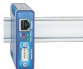
COM-Server++ 1x RS232/RS422/RS485 Serial-Device-Server