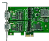
Tarjetas de interfaces RS485