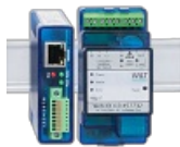
Web-IO digitale 24 V