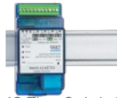
Web-IO Time Switch 4xOut