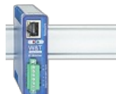
Watcher IP 2x input, 2x output

Monitoraggio rete Allarme in caso di avaria apparecchio