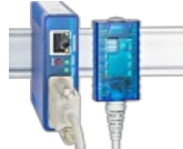
Sensori web per l'aria ambiente

Qui trovate apparecchi con sensori per %rH, hPa & CO 2