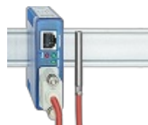
Termometro web Pt100/Pt1000 1x Pt100/Pt1000 con collegamento DB9