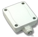
Sensore esterno Pt-100 classe B

in alloggiamento IP65, collegamento a 4 fili