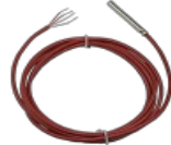
Sensore cavi Pt-100 classe A

Lunghezza del cavo 2 m, collegamento a 4 fili