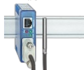
Termometro web NTC