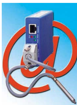
W&amp;T Termómetros Web