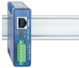
Web-IO 4.0 Digital 2xIn, 2xOut