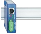
Web-IO 4.0 Digital 2xIn, 2xOut