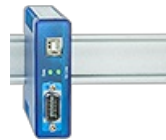
Sinopsis Interfaces RS485 seriales