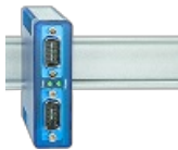
Aislador RS485 para montaje en raíl DIN

En la instalación tiene que cuidarse de la polaridad correcta de los pares de cables, puesto que una polaridad falsa lleva a una inversión de las señales de datos. Especialmente en dificultades en relación con la instalación de nuevos terminales cada búsqueda de error debería comenzarse con el control de la polaridad del Bus.