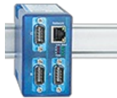
Sinopsis Interfaces de red RS485

En función de las interfaces disponibles, progresivamente se puede equipar sin problemas los terminales que no dispongan de conexión RS485 con esta interfaz por varios métodos: