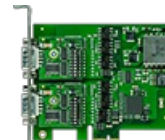
Sinopsis Tarjetas de interfaces RS485

Un bus RS485 puede tener en principio una estructura de sistema de dos hilos o de cuatro.