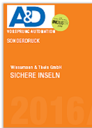
Sichere Inseln Sonderdruck aus "A&D Kompodium" PDF: ca. 190 KB