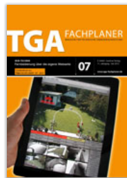
Fernbedienung über eigene Webseite Sonderdruck aus "TGA- Fachplaner" PDF: ca. 890 KB