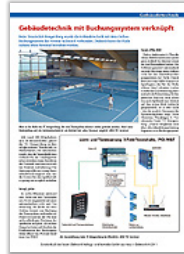
Gebäudetechnik mit Buchungssystem verknüpft Sonderdruck aus "Haus & Elektronik" PDF: ca. 884 KB