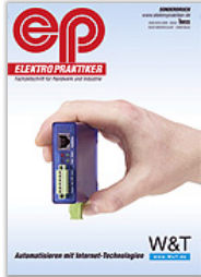
Automatisieren mit Internet-Technologien Sonderdruck aus "Elektropraktiker" PDF: ca. 356 KB